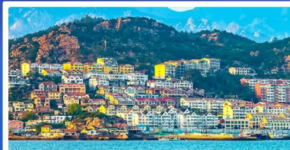
หมู่บ้านประมงซาโจวโข่ว