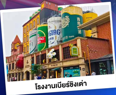
โรงงานเบียร์ซิงเต่า