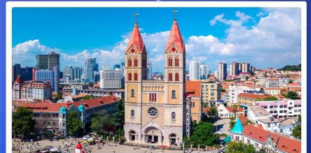
โบสถ์เซนต์โมเคิล