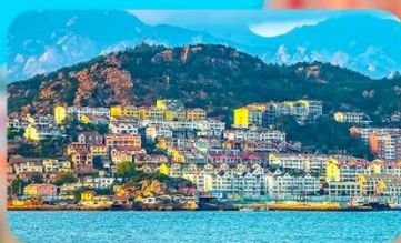
หมู่บ้านประมงชาจื่อโจว