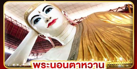
พระนอนตาวาน