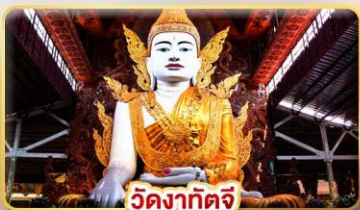
วัดหงาทัดจี