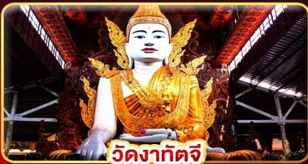
วัดงาทัดจี

สักการะ 3 มหาบูชาสถาน พักบนอินทร์แวงน 1 คืน